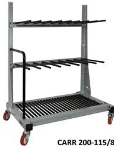
CARR 200-115/8 Q